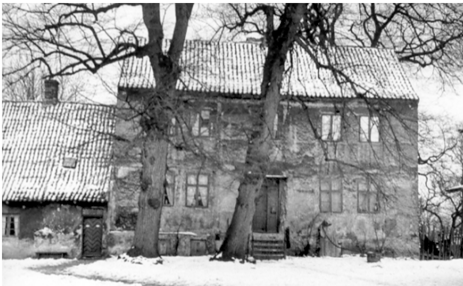
Svanelejegaard, også kaldt Dyvekes Gaard og sidst kaldt Rødegård inden nedrivning i 1942-43.

Denne Ø er gjort til en meget frugtbar Ø ved hjælp af disse Indbyggers store Arbejdsomhed og Industrie. Der findes ikke en udyrket Plet Jord undtaget det, som ligger til Fælles, hvoraf noget indtages næsten hvert aar af Øvrigheden.