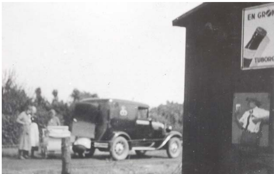
Bager Løves bagervogn bringer brød til Vestamager. 1935.

ger inde i København, så på disse torvedage fik de fleste fra øen opfyldt deres indkøbsbehov.