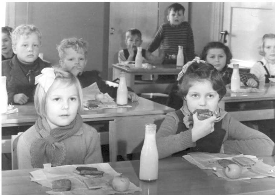
Skolebespisning ca. 1950.