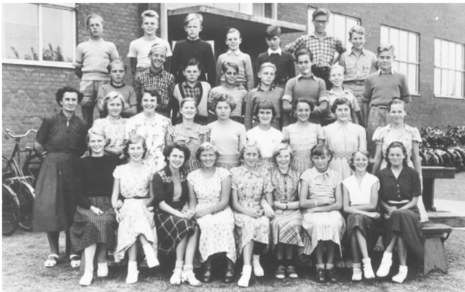
1.M, Korsvejens skole 1950/51. - Bagest fra venstre: