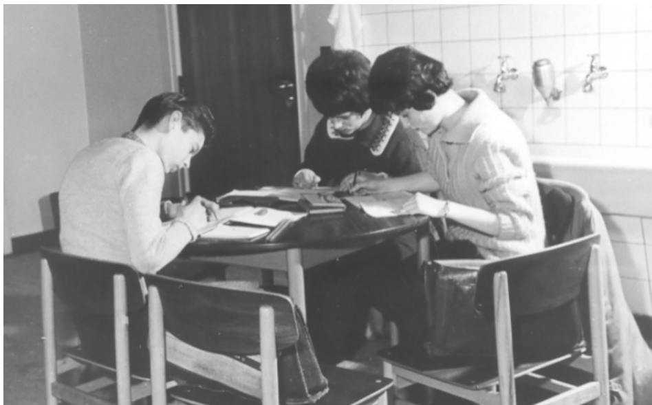
Tårnby Skole 6.a, 1959.

bestemme, at elever der ikke kan følge med i eksamensmellemskolen overføres til en eksamensfri mellemskole.