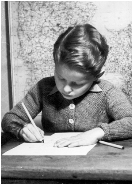
En skoleelev fra 1957.

søskende på forældrenes begæring såvidt muligt optages i samme skole.