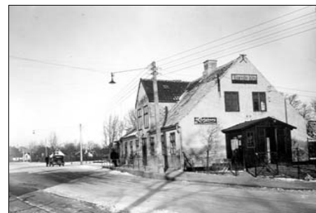
Tårnby Kro, Engelsvej - 1930-erne. Det tidligere Fattighus i Tårnby Sogn. Juleaften 1893 fik lemmerne ekstraordinært følgende fine mad : ”Oksesteg, Rødkaael, Sigtebrød, Øl og Brændevin samt Julekage og Puns ”

1891 overfaldt to lemmer under indflydelse af brændevin en tredje. Voldsmændene blev idømt 3 dage på vand og brød. Sagen kom for sognerådet, der fra økonomaen på fattighuset havde fået oplyst, at der var en hel del urolige og drikfældige lemmer. Disse ville sognerådet forsøge at sende på en arbejdsanstalt. Fattighuset eksisterede indtil omkring 1920, hvor ejendommen blev indrettet til en mere