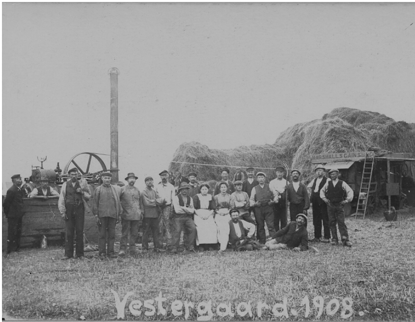
Tærskværket på besøg på Vestergård i Maglebylille 1908