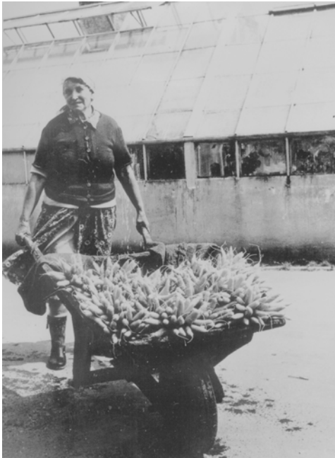
Der er høstet tidlige gulerødder på Ny Kastrupgård ca. 1950

På den lille fælled ved Nøragersmindevej, hvor rideklubben ligger i dag, og på den store fælled for enden af Frieslandsvej op til det inddæmmede Vestamager blev de berømte Kongelundskartofler dyrket i sandjord.