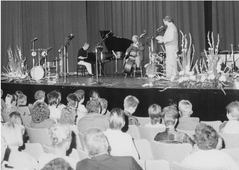
"Flygtning 90" holder koncert i Kastrup Bio.

605 Pladsen, og de magelige Stole er udført af Odense Stolefabrik. Tæpper og Løbere er leveret af Dekorator og Tapersermester Hørgensen, Islands Brugge, og de smukke Blomsterarrangementer skyldes Firmaet Bartholdys Blomster, Torvegade 55. Det nye moderne Tonefilmsanlæg er leveret af Bang og Olufsen, Struer, og Professor Ingerslev har staaet for den akustiske Regulering. Det ny Filmlærred er 5x12 m og kan benyttes baade til Wide-schren og Cenemacap Film.