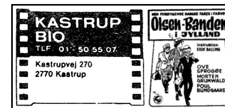
Forestilling i Kastrup Bio den 9.1.1988.