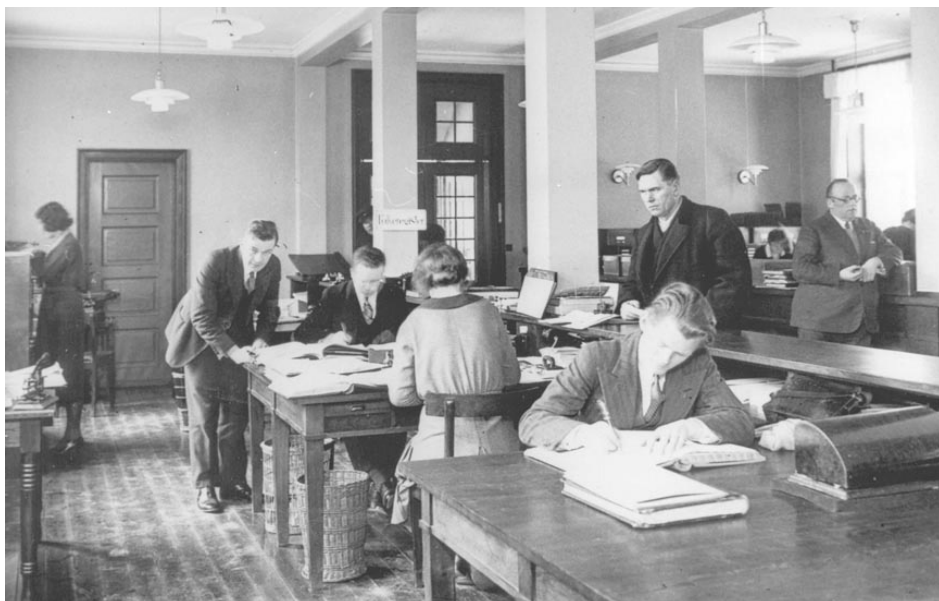
Administrationen på rådhuset i Kastruplundgade ca. 1930'erne.