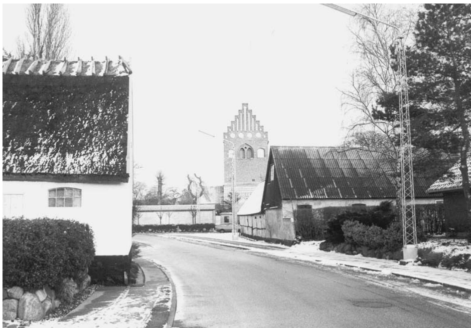
Smedekærvej, tidl. Smedevej, 1983.

Kastrups Krostræde er bibeholdt, mens Krostræde i Tårnby i 1915 blev til Tårnby Stræde og omkring 1930 Vestre Bygade. Tårnby Stræde gik fra daværende Kirkevejen nu Englandsvej og helt ned til gadekæret.