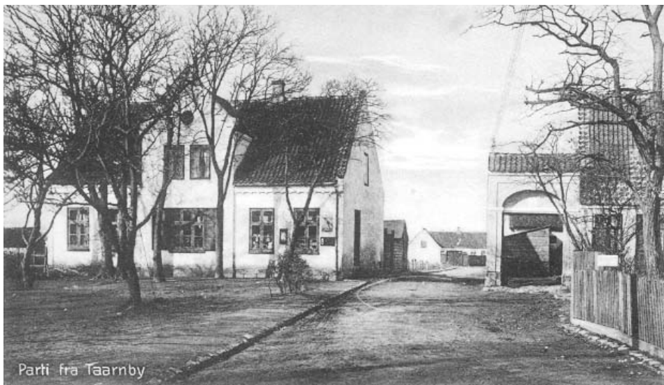
Vesterbygade tidligere Krostræde med købmandsbutikken, hvor der for snart 200 år siden også var kro. Ca. 1920.

stemte om følgende forslag: Mirabella Allé, der fik 0 stemmer, Latoryrus Allé 9 og Balsam Allé 2 stemmer, 12 ønskede at bibeholde Th. Jensens Allé. Th. Jensen var i øvrigt formand fra 1900-1905 for Orlogsværftets byggeforening der grundlagde Tårnby Villaby. Begrundelsen for at ændre navnet kom denne gang fra sognerådet. Et nyt kvarter ved lufthavnen skulle opkaldes efter kendte flyvere - og et af de nye vejnavne Kofoed Jensens Allé kunne forveksles med Th. Jensens Allé, og dermed ikke godkendes af Fællesudvalget i Københavns Kommune. Derfor blev navnet ændret denne