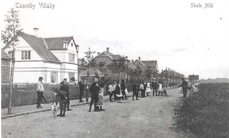
Skole Allé senere Pyrus Allé. Til højre ses grunden hvor man oprindeligt havde påtænkt en skole, i stedet kom der plejehjem. Postkort fra Tårnby Villaby, ca. 1906.

fællesudvalget med følgende forklaring: ”Da disse navne må anses for mindre heldige og man i det hele taget anser det for vanskeligt at finde gode brugelige vejnavne indenfor gruppen ”Kemiske Navne” har sognerådet vedtaget i distriktet øst for Kastrupvej og nord for Saltværksvej i stedet for kemiske navne at anvende navne af gruppen ”træ, blomster og plantenavne”. De to nævnte navne foreslås benævnt Balsamvej og Salvievej” - og sådan blev det.