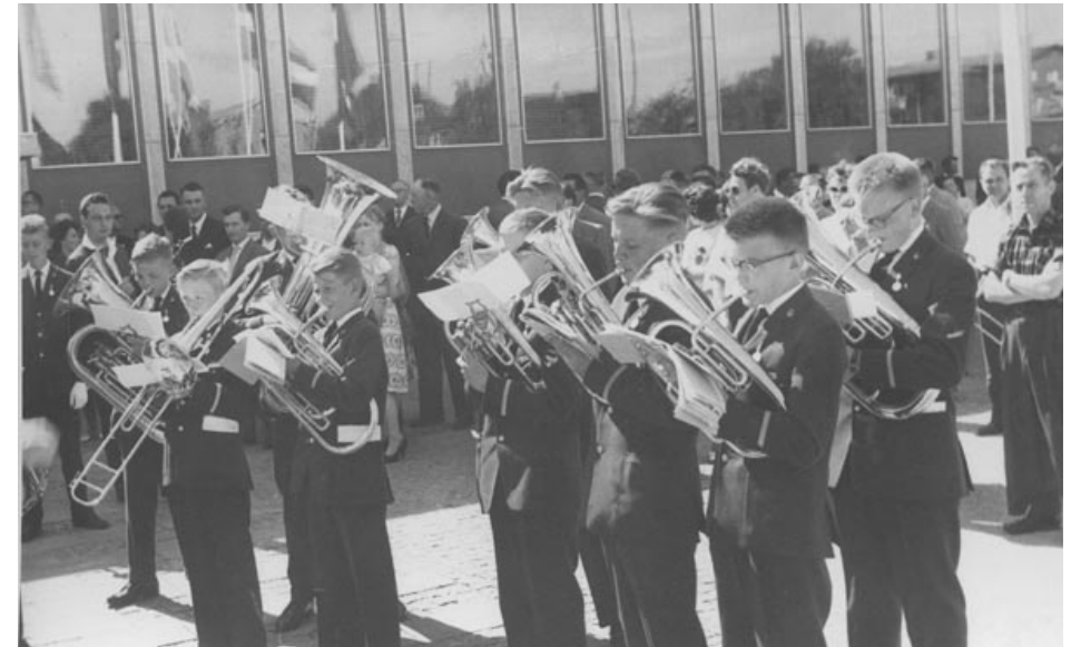
Rådhuset blev indviet den 24.6.1960 med musik og taler.

Her spiller det lokale "Skotterne" for de 500 indbudte gæster.