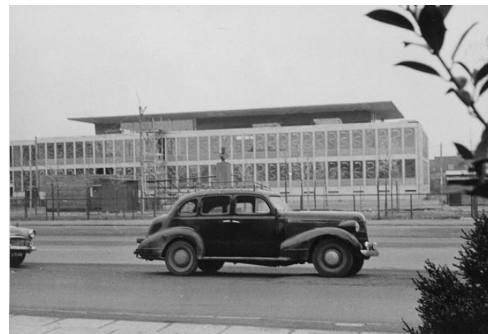
Rådhuset kort før det stod færdigt i 1959/60. Bag bilen anes Frederik den VII's Mindestøtte, der kort efter blev flyttet til kommunens materialegård på Nordmarksvej. Materialegården nedbrændte nogle år senere og dermed også mindestøtten.

måtte efter nogle års forsøg på forbedringer slukke for vandet. Det oprindelige springvand får kun lov til at springe ved meget særlige lejligheder. I stedet har man for ca. 10 år siden indsat et