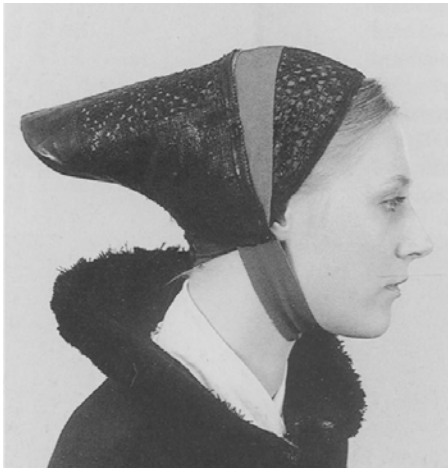
Hovedtøj fra St. Maglebydragten.

de, hvorfra der kunne sælges hurtigere og mere. Man kørte aldrig hjem, før vognene var tomme. Om dette kan fortælles mange sjove ting, om hvordan de konkurrerede med hinanden.