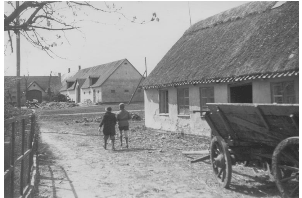
Fra Maglebylille i 1970 lige før husene måtte vige pladsen for lufthavnen.

Omkring 1940'erne blev anvendelsen af menneskelig gødning forbudt af sundhedsmyn-