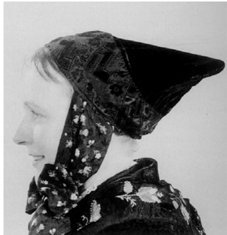
Tårnbydragten eller Danskedragtens hovedhøj.

Hjemme blev der snakket meget om andres vogne, heste, kørsel, påklædning, afsætningstalenter og stablemetoder. Det var af stor betydning, at man værdsatte sig selv. Derfor så man ofte en konkurrence m.h.t. at stable kål og andre grønsager så smukt og indbydende som muligt. Den ene ville overgå den anden. Resultatet blev ofte fantastisk, men krævede også en enorm ind-