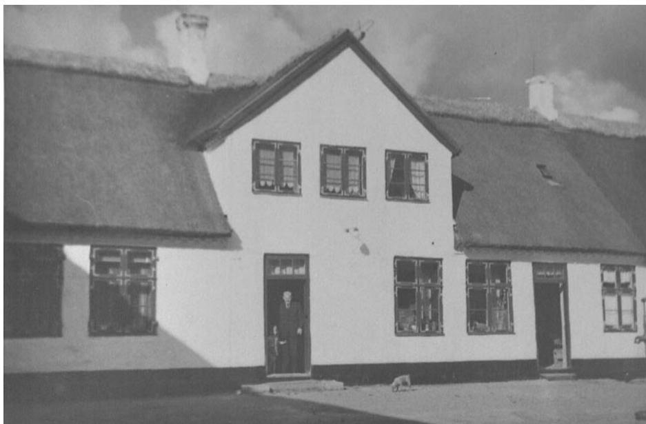
Nordregårds stuehus. Foto ca. 1950

En stor træbalje blev sat ind i bryggerset, masser af varmet vand hældt i. Håndklæde og sæbe og noget nyt tøj blev lagt ved siden af. Hvis man fangede hans blik, så man tydeligt, at noget frygteligt skulle ske. Men ind kom han, og når han kom ud, var alt forandret. Ny skjorte, andre bukser uden huller og nye træsko, en helt anden farve på hænder og ansigt – nu kunne julen begynde.