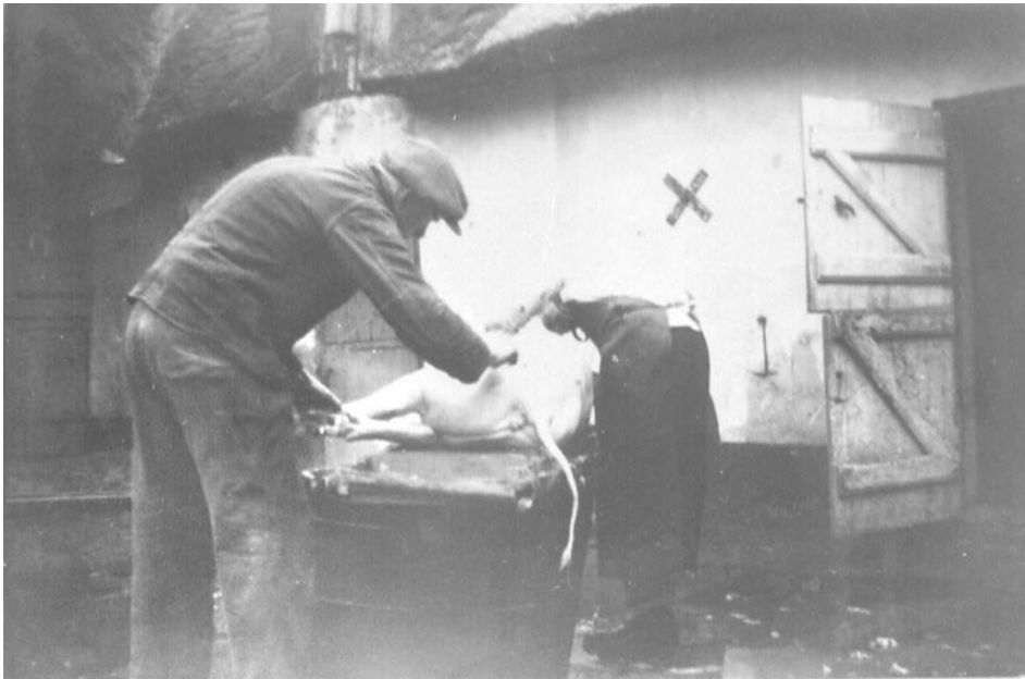
Slagtning af gris på Thybos gård i Maglebylille i 1940'erne