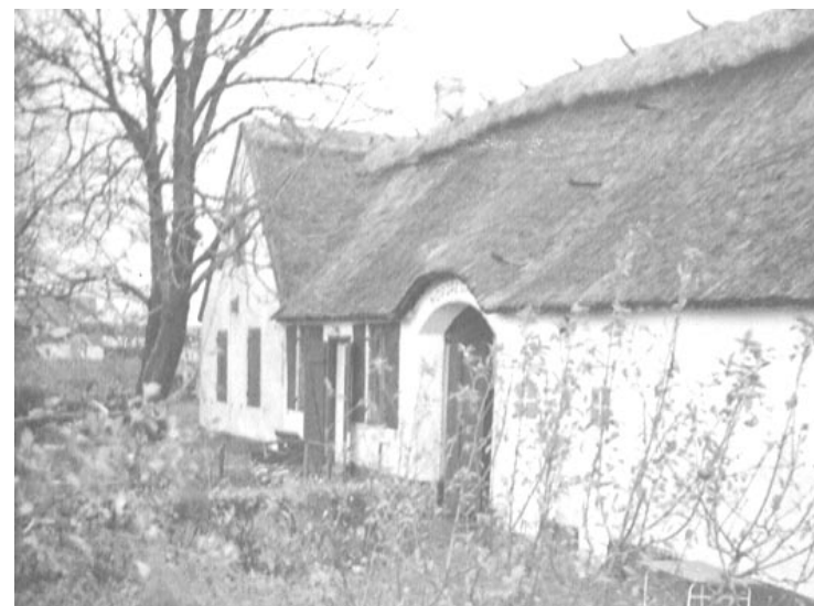
Nordregårds længe. Foto ca. 1950.

Juletræsankomsten faldt altid sammen med konfektilberedning. Det var også en stor dag. Børn fik plads ved det store køkkenbord og øjnene fik noget at bestille. For vi vidste jo fra sidste år, hvor dejligt det smagte. Når konfekten var rullet og skåret, blev det lagt på store fade, dækket med pergamentpapir og båret væk - op bag de låsede døre. Sidste år havde pynten været små sølvkugler og krymmel i alle farver, og det skulle være en overraskelse, hvad det blev i år.