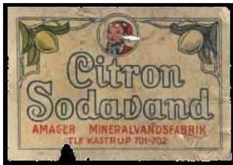
Etiket fra Amager Mineralvandsfabrik.

bryggeri, malteri eller anden dermed beslægtet eller konkurrencevirksomhed.