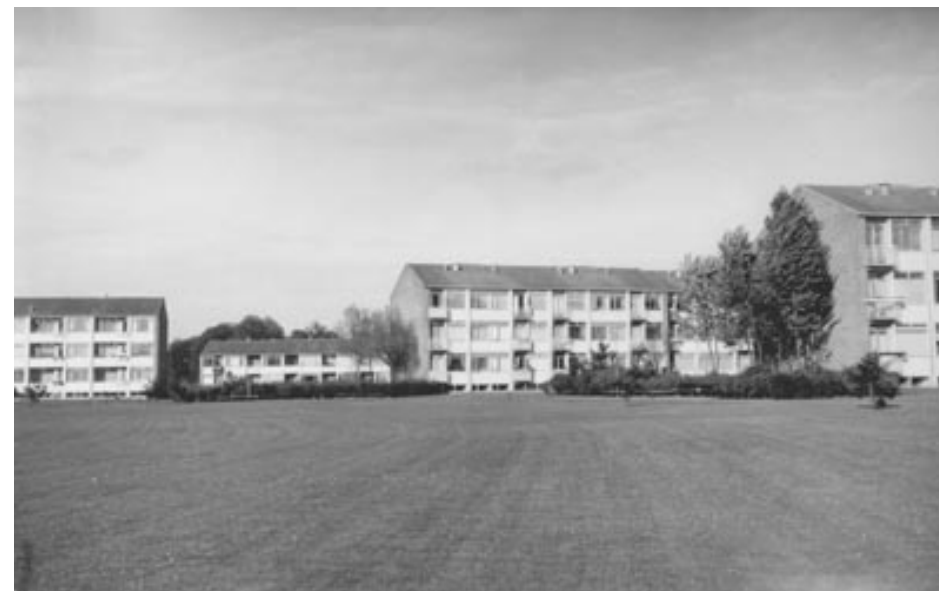
Lufthavnsparcken i Kastrup, et boligbyggeri med ca. 500 lejligheder bygget i 1950-51.