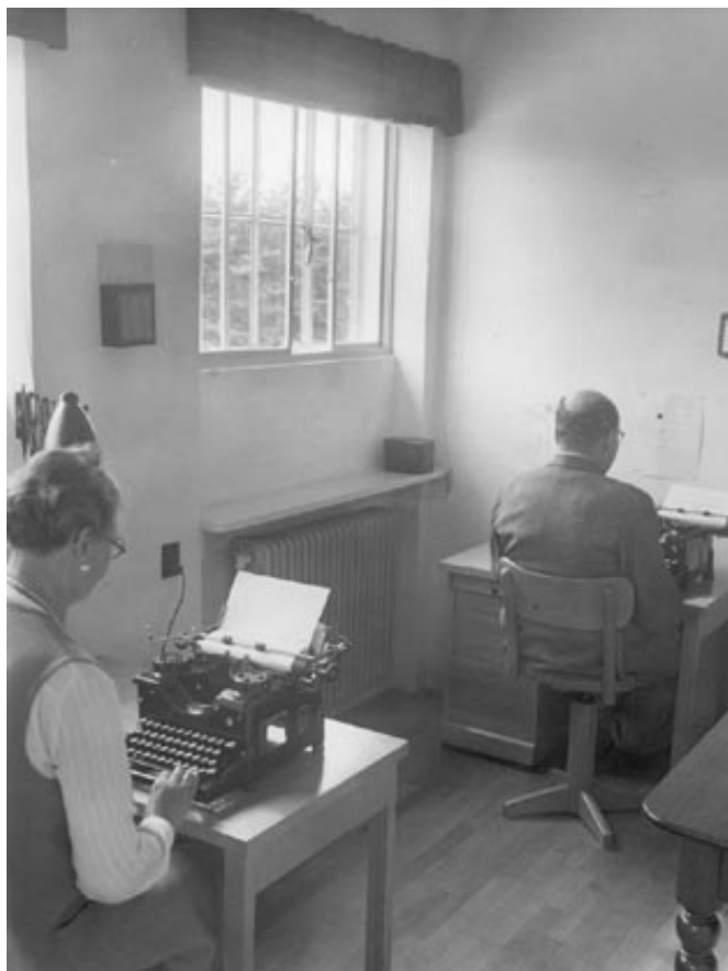
Kontor hos Orthana Ca. 1950'erne

familier ønskede egen bolig, eller, hvis der ikke var råd, så i første omgang en grund med et lille kolonihavehus.