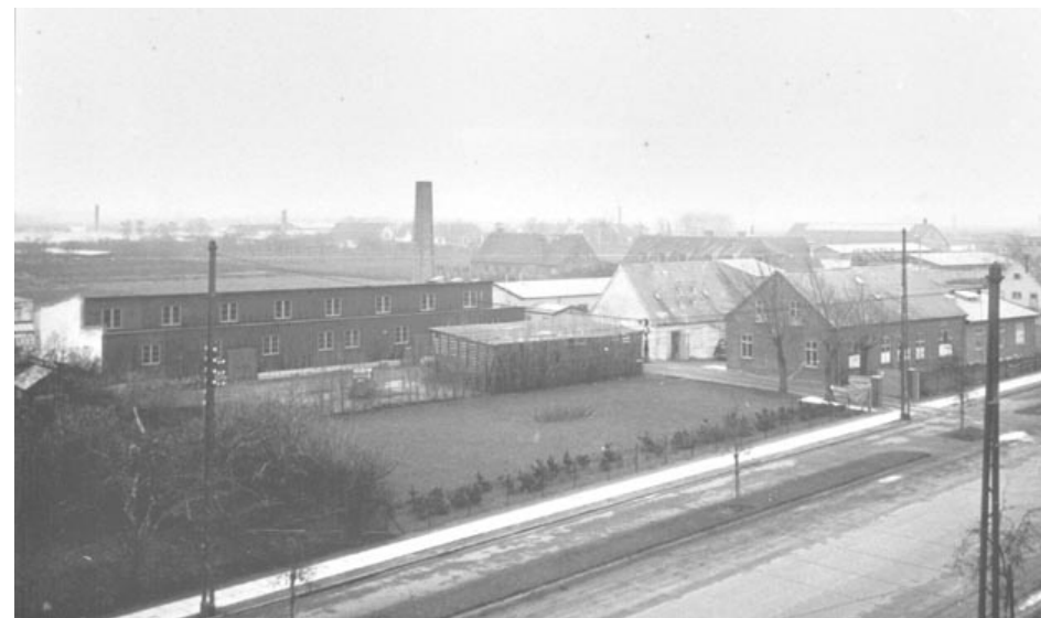
A. Hede og Co., Amager Landevej 87. Foto ca 1947.

I 1925 var der kun blevet bygget 16 huse til helårsbeboelse, kun halvdelen af grundene var bebygget og fortrinsvis med sommerhuse og lysthuse. Flere af køberne havde solgt deres grunde igen, da de ikke havde økonomi til det.