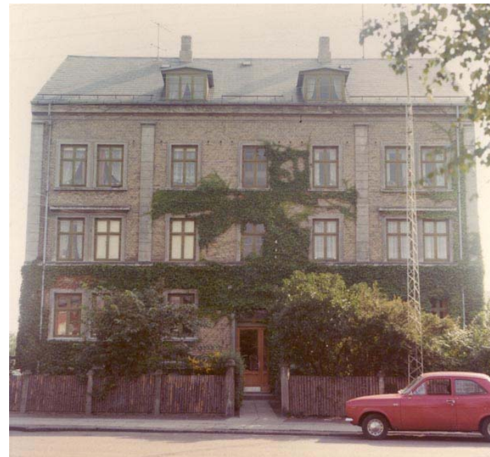
"Tilfredshed" på Nordmarksvej 71 i Kastrup, I slutningen af 1800'tallet blev nogle af lokalerne i huset desuden brugt til børnesanatorie, deraf navnet.

En anden fabrik på Løjtegårdsvej 147-149 var Hans Merser , der i fra ca. 1950'erne fremstillede centrifugalpumper til vandforsyningsanlæg, cirkulationspumper til centralvarmeanlæg, og spildevandspumper.