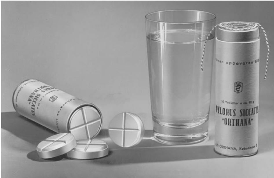
Tabletter fra Orthana. Reklamefotografi for Pylorus Siccatus, ca. 1955.

kom med en fælles meddelelse. Beboerne i Tårnby skulle registrere og tilbagemelde de lugtudslip, der kom fra fabrikken. Samarbejdet skulle endvidere supplere og munde ud i en endelig miljøgodkendelse senest 4 år senere år 2000.