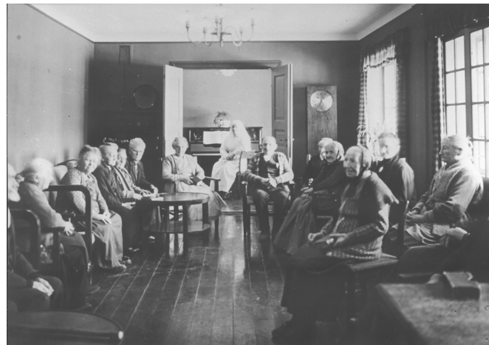
Et af hjemmets opholdsstuer med musikværelset i baggrunden. Ca. 1930-1935.

Amagerbanens rute blev i 1907 lagt på østsiden af øen for at tilgodese industrien og den dengang tættest befolkede del af kommunen. Man satsede dog ikke først og fremmest på persontrafik men på godstransport til og fra de mange industrier i Kastrup, hvor flere fabrikker fik sidespor. Det oprindelige trinbræt ved Syrevej blev allerede i 1908 erstattet af en station, da Dansk Svovlsyre og Superphosphatfabrik tegnede aktier i Amagerbanen for 15.000 kr., samtidig med, at der blev anlagt sidespor til fabrikken herfra. Sidespor var der endvidere til Kastrup Havn, hvor der lå et større industriområde samt ved Tømmerup