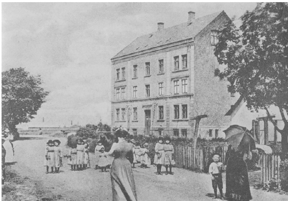
Børnesanatoriet i Tilfredshed. Fra artikel i Illustreret Tidende 1893.