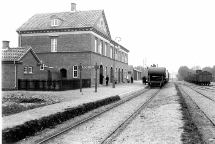
Kastrup Station. I baggrunden latrinovne. Ca. 1912

Ved stationen blev endvidere bygget lamme- og svinefold og et såkaldt vare- eller pakhus, begge opført i tømmer.