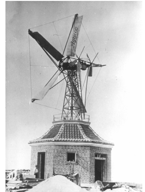
Pumpehuset under opførelse på Amager Strandvej 281-283. Foto 1923.