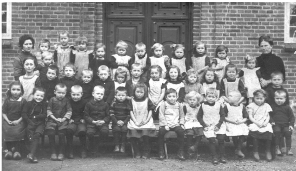
Børn foran asylet i Menighedshuset, Kastruplundgade. Ca. 1915