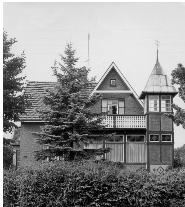
Ambra Allé 29. Tårnby Villabys vartegn. 1975

Fra 1.4.1921 blev der oprettet en realklasse ved den Kommu-