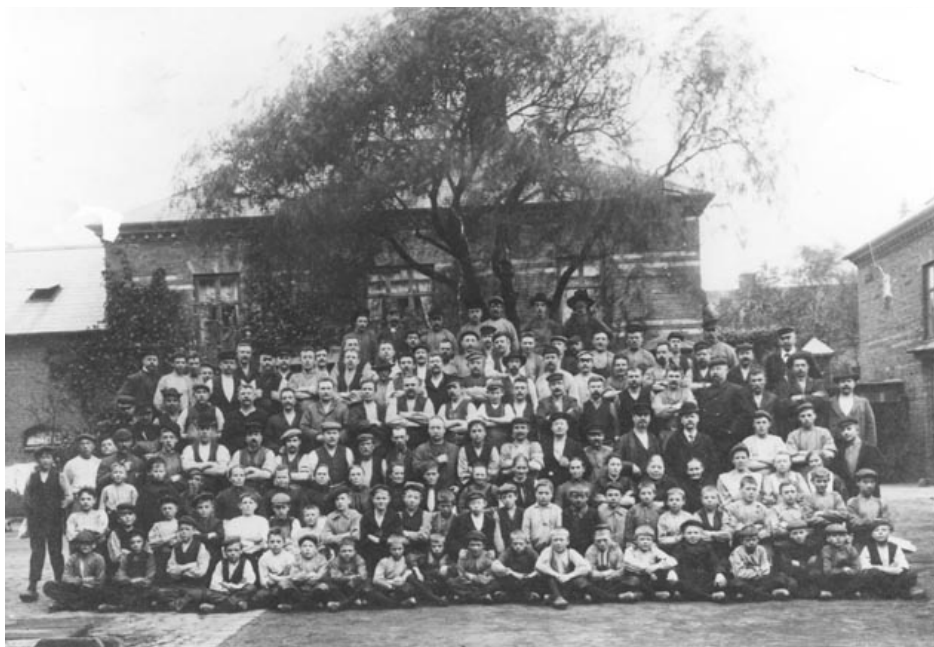
Personalet på glasværket, ca. 1910. Alle de mange hyttespurve, børn der arbejdede på glasværket, sidder på de foreste rækker.

Beslutningen ændrede arbejdet i hytten. Man måtte nu have to hold hyttedrenge, da glasmagerne på dette tidspunkt arbejdede i 10 timer dagligt.